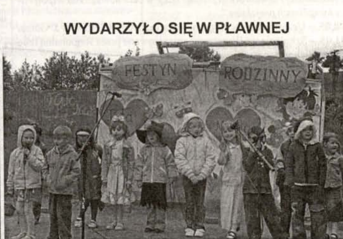
WYDARZYŁO SIĘ W PŁAWNEJ