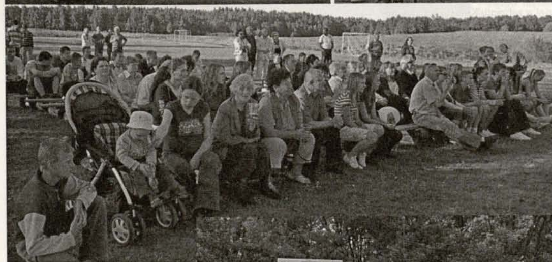
ZAPRASZAMY DO LEKTURY!