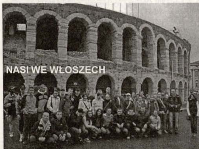
NASI WE WŁOSZECH

NAJŚWIEŻSZE CIEKAWOSTKI Z MIASTA I GMINY!