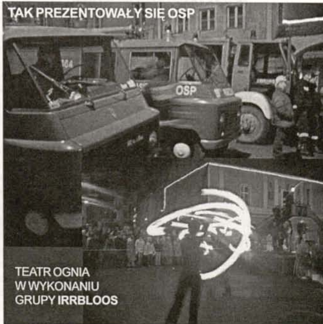
TAK PREZENTOWAŁY SIĘ OSP