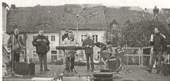
SKAUCI Z NIELEŚNA

W ubiegłym roku udało nam się zebrać na konto Orkiestry 2757,15 zł