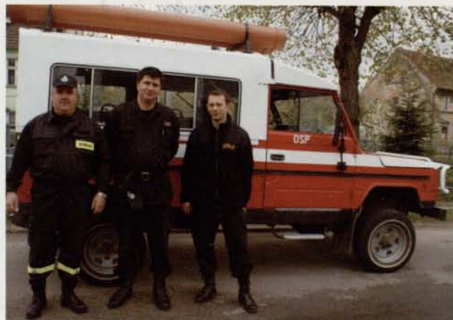
Dar od wójta i strażaków z Gminy Mszana Dolna