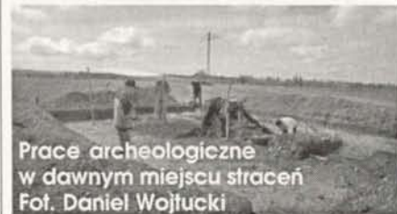
Prace archeologiczne w dawnym miejscu straceń

Podczas prac archeologicznych udało się potwierdzić panowanie podobnych zwyczajów także dla samego Lubomierza. We wnętrzu szubienicy odkryto w pierwszej kolejności liczne luźne kości ludzkie, należące zapewne do któregoś z powieszonych skazańców.