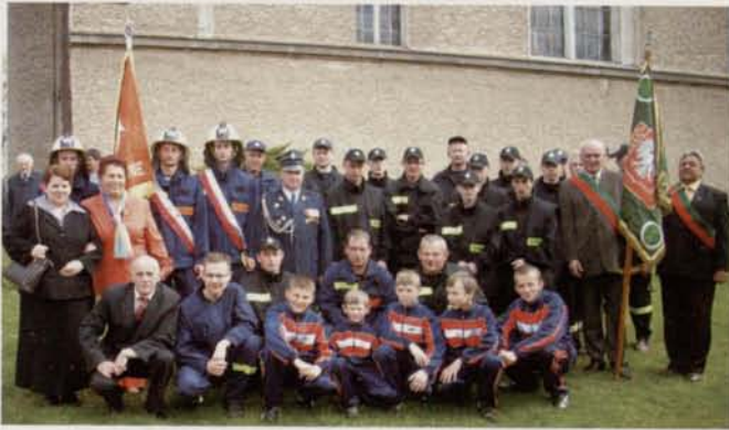
Dzień Strażaka w Olesznej Pogórskiej

O wydarzeniach, które ilustrują zdjęcia wewnątrz gazety.