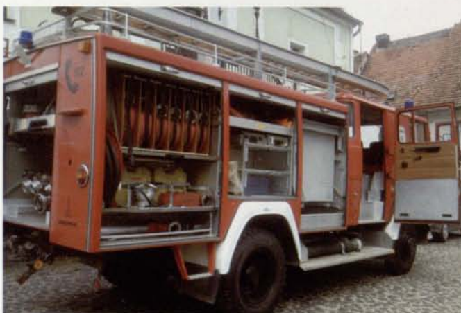
Wóz strażacki dla OSP Miłęcice