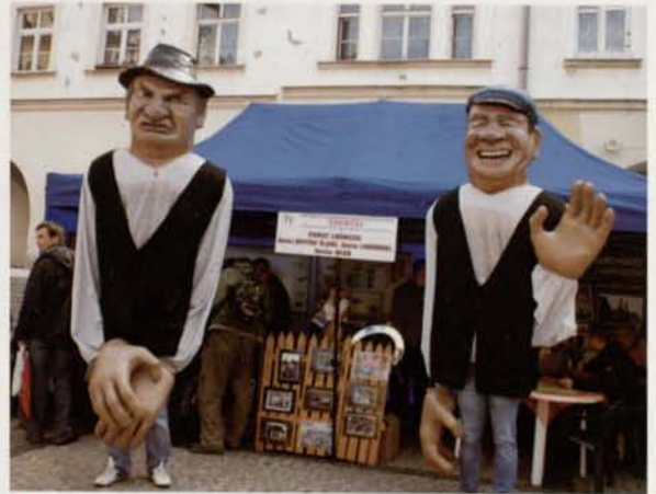
Targi Turystyczne w Jeleniej Górze