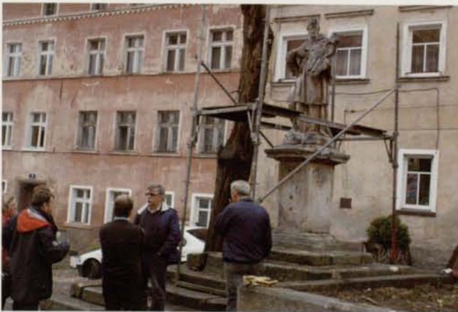
Troska o zabytki