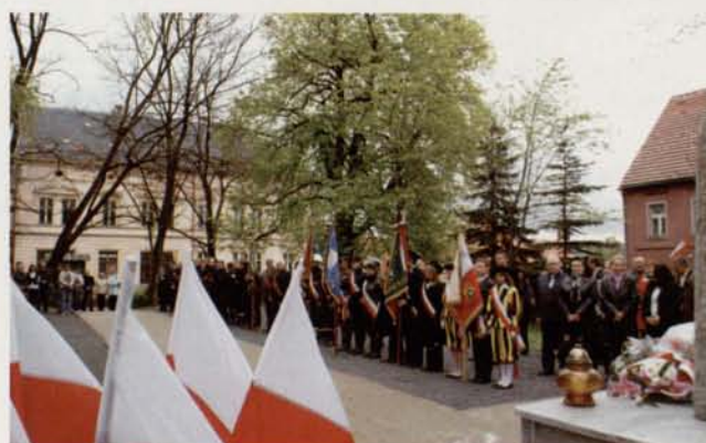
3 Maja pod Pomnikiem Wdzięczności w Lubomierzu