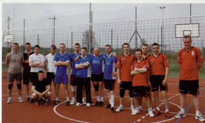
Otwarty Turniej Piłki Siatkowej