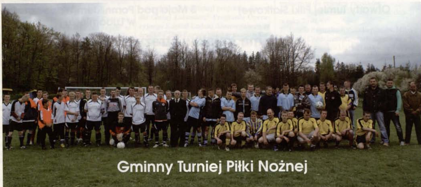
Gminny Turniej Piłki Nożnej

O innych ciekawych wydarzeniach wewnątrz numeru. Zapraszamy do lektury!