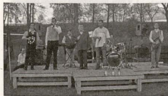
Zespół „Skauci” z Nielestna