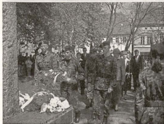
Pod pomnikiem wdzięczności