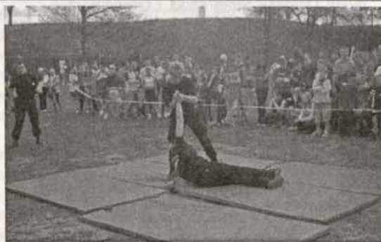
Pokazy przyszłych pracowników ochrony ze Szkoły „Kobra” w Jeleniej Górze