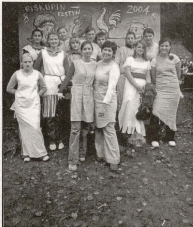
Uczestnicy wycieczki do Biskupina

Wiele uwagi poświęcono obliczu duchowemu kultury Celtów, jakże bogatemu zarówno w sferze religii z wyjątkową rolą Druidów (długowłosych kapłanów), niepowtarzalną architekturą i wystrojem świątyń oraz miejsc kultowych, jak i w sferze literatury i sztuki - do dziś popularnej wieloma motywami w otaczającej nas rzeczywistości.