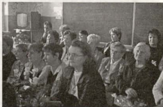
Uroczystości w Pasieczniku

W numerze: WIELE AKTUALNOŚCI CIEKAWOSTEK KRONIKA POLICYJNA HUMOR