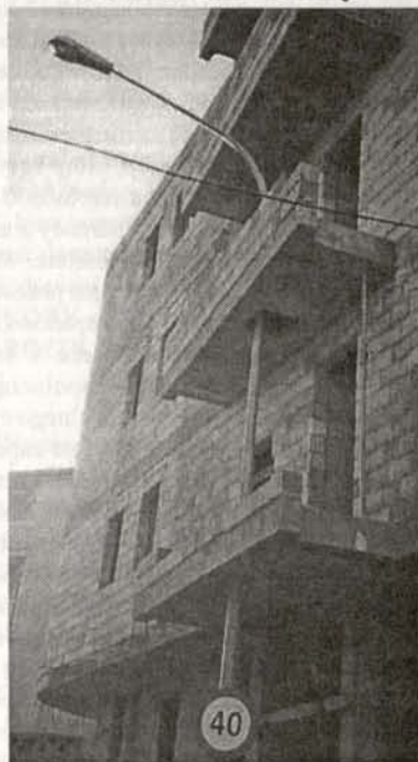
ONA TU NAJWAŻNIEJSZA!