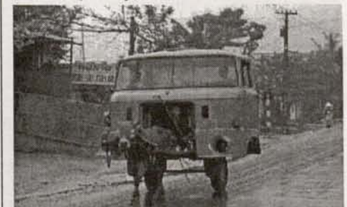
Gdzie zostało zrobione to zdjęcie?

Wydawca: OKiS w Lubomierzu. ADRES REDAKCJI: 59-623 Lubomierz, ul. Wacława Kowalskiego 1. Tel. 7833-573. Zespół redakcyjny: Jadwiga Sieniuc - redaktor naczelna, Henryk Lange, Stanisław Nowotny, Jacek Szramowiat, Teresa Jakimowicz, Lucyna Stachowiak, Ryszard Kwiłsza. Wpisywanie tekstów, skład - J. Sieniuc. Skanowanie, druk: tel. 75-363-43. Zdjęcia: J. Sieniuc, J. Szramowiat. Nakład 300 egz. Cena 2.00 zł. Redakcja zastrzega sobie prawo dokonywania skrótów i koniecznych zmian stylistycznych w nadsyłanych materiałach. Za treść ogłoszeń redakcja nie odpowiada. Nr zamknięto 20.06.2004 r. E-mail: redakcja@sami-swoi.com.pl