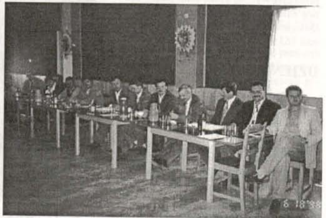
Ostania Sesja Rady Miejskiej Gminy Lubomierz 19.06. 1998 r