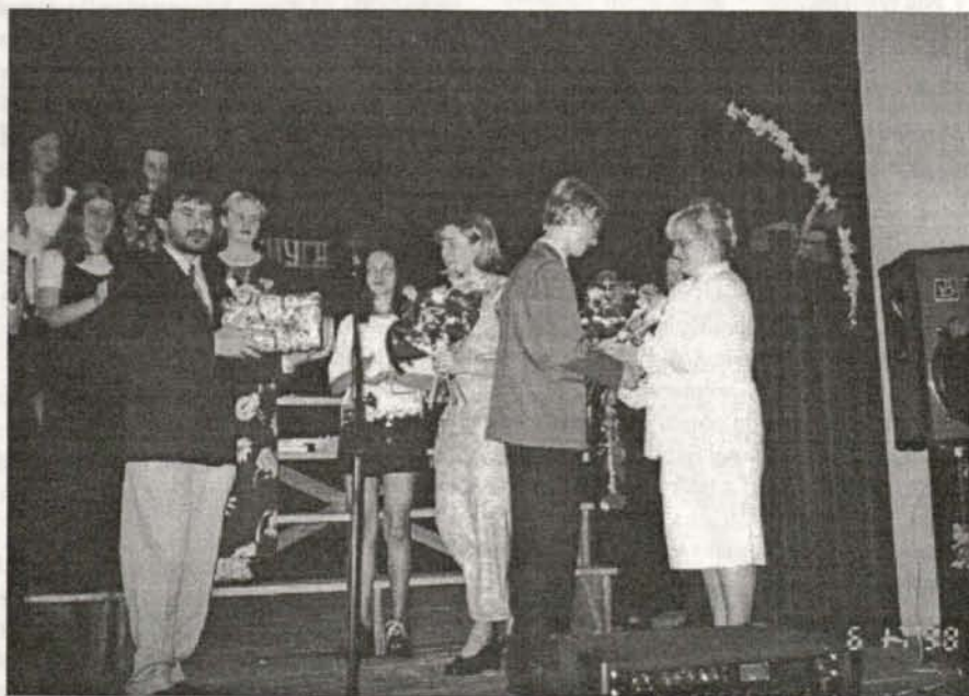
Zakończył się rok szkolny. Tak żegnali swą szkołę uczniowie klas ósmych w Lubomierzu

ZBGKiM w Lubomierzu zatrudni od zaraz 3 pracowników w zawodzie ogólnobudowlany murarz - dekarz. Informacje udzielane są w siedzibie zakładu.