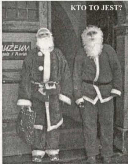
KTO TO JEST?

Z pewnością dostarczy wielu wzruszeń, pozostawi ciepłe wspomnienia. Napiszemy o tym w styczniowym wydaniu gazety.