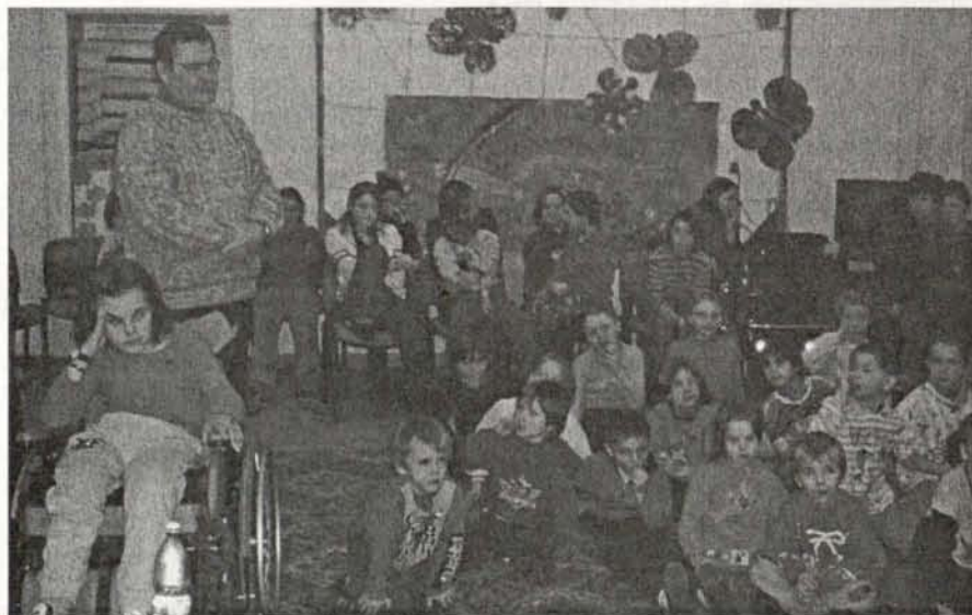
Wizyta w Domu Dziecka dostarczyła wielu emocji, wrażeń i wzruszeń. Opowiemy o tym w styczniowym wydaniu gazety!

Opiekunowie Samorządu: IZABELA PIĄTEK, OLGA BŁAŻEJOWSKA