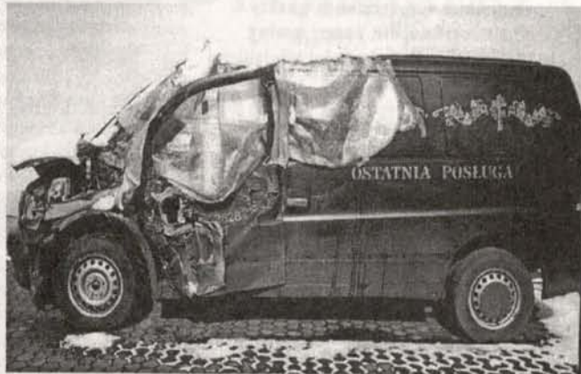
Podpis sam się układa: I CO TERAZ?