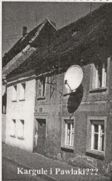
Kargule i Pawlaki???

Panią z Milećcic, która podała prawidłowe rozwiązanie naszej zagadki zdjęciowej z poprzedniego wydania „Samych Swoich” zapraszamy do redakcji po odbiór nagrody. Zdjęcie zostało zrobione na budowie przy ul. Wacława Kowalskiego w stronę przystanku PKS. Gratulujemy, bo prawidłowych odpowiedzi było niewiele!