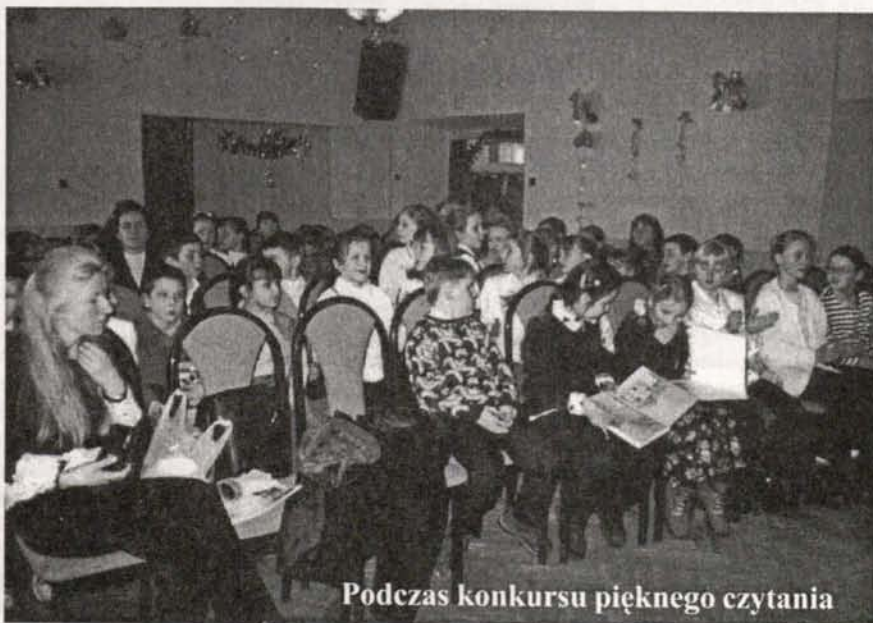
Podczas konkursu pięknego czytania