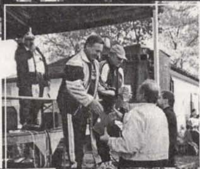
a tak odbieraliśmy zasłużone nagrody