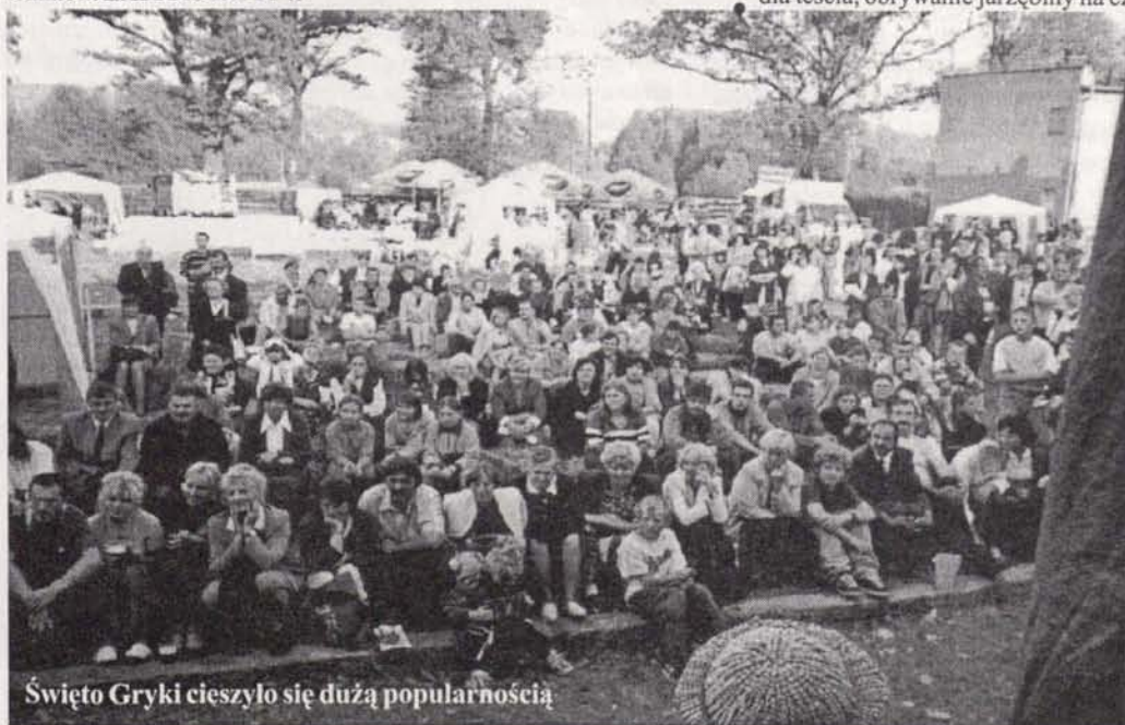
Święto Gryki cieszyło się dużą popularnością