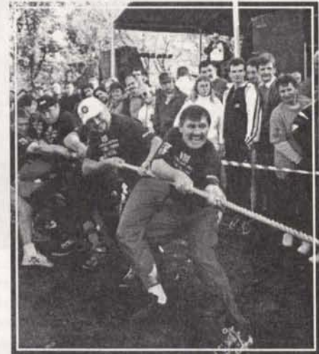
Tak zażarcie walczyliśmy we wszystkich konkurencjach