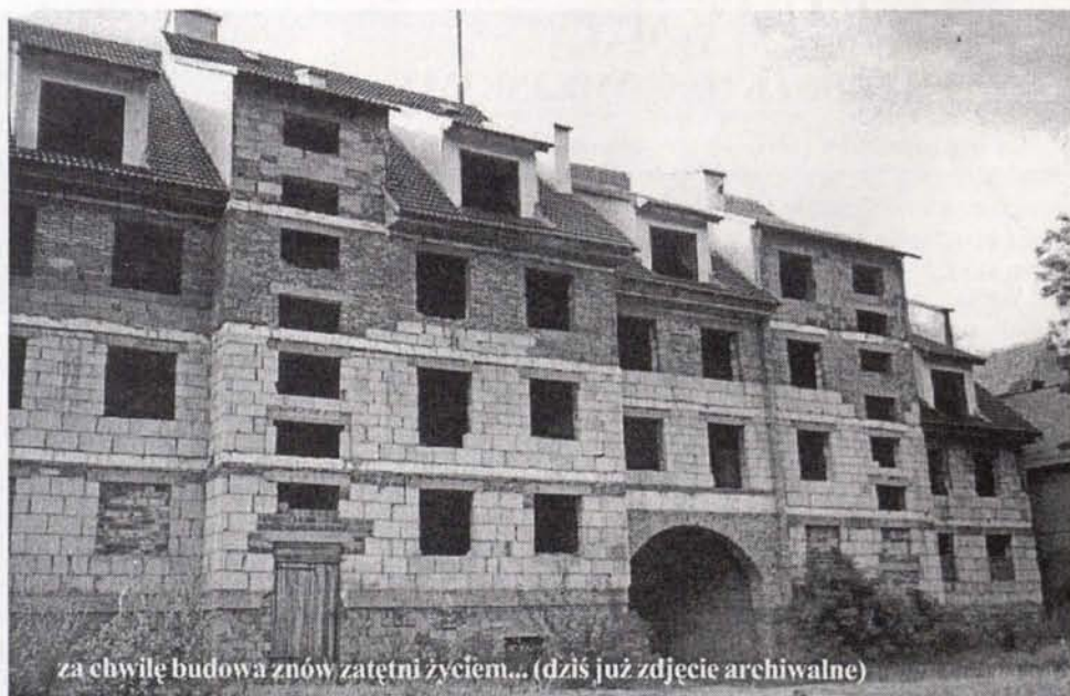
za chwilę budowa znów zatętni życiem... (dziś już zdjęcie archiwalne)

Dodatkowe informacje można uzyskać w biurze TBS -u. Mieści się ono w Urzędzie Gminy i Miasta Lubomierz.