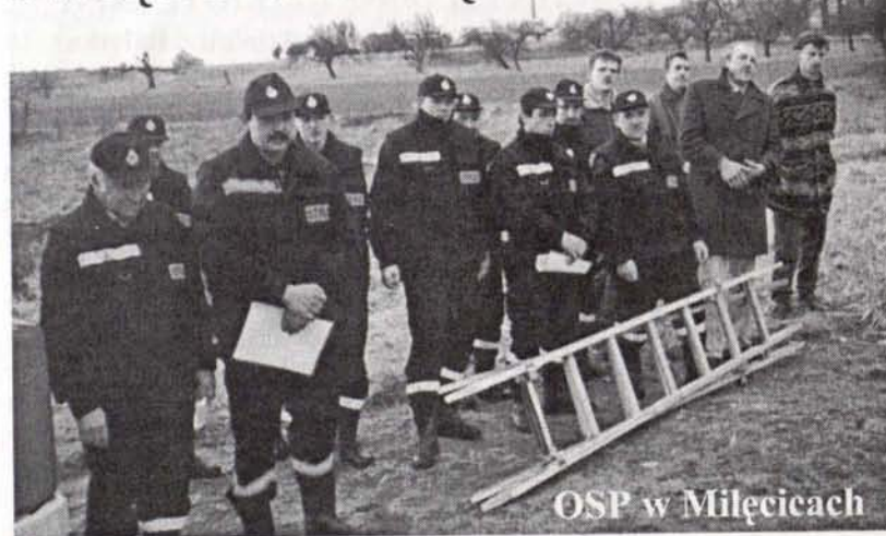
OSP w Milećcicach