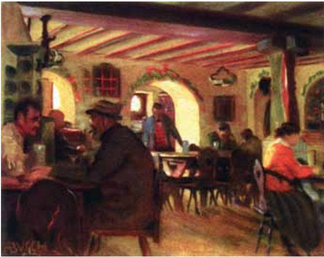
Arnold Busch: Bauernkretschen in der Lukasmühle, 1925 Arnold Busch: Karczma chłopska w młynie św. Łukasza, 1925