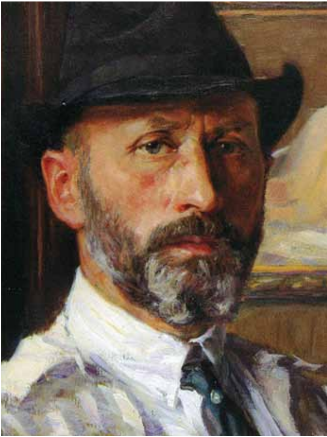
Arnold Busch , Selbstbildnis um 1920 Arnold Busch, autoportret ok. 1920 r.